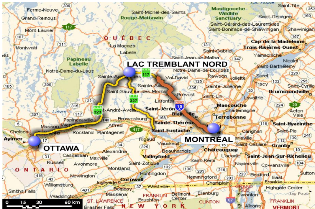
Figure 1 : Localisation de la Municipalité de Lac-Tremblant-Nord par rapport aux pôles urbains

Sur le plan régional, la Municipalité de Lac-Tremblant-Nord fait partie de la MRC des Laurentides. Elle est bornée au nord et à l'ouest par la municipalité de Labelle, à l'est et au sud par la Ville de Mont-Tremblant et au sud-ouest par la Municipalité de La Conception. La figure 2 illustre la situation régionale actuelle.