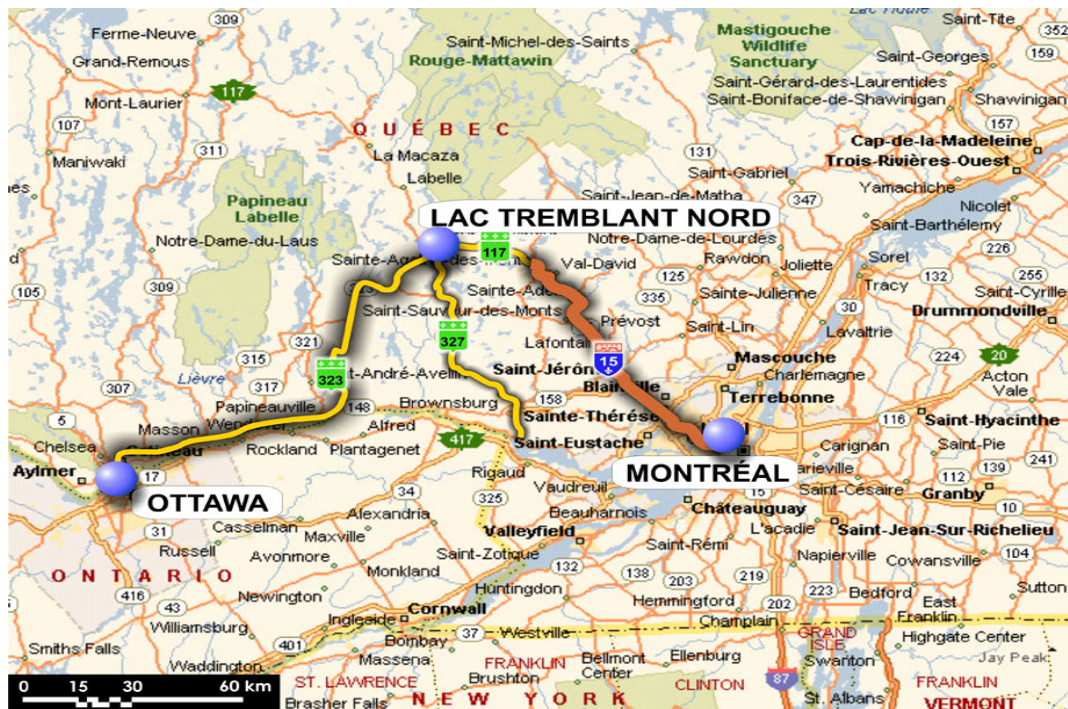
Figure 1 : Localisation de la Municipalité de Lac-Tremblant-Nord par rapport aux pôles urbains

Sur le plan régional, la Municipalité de Lac-Tremblant-Nord fait partie de la MRC des Laurentides. Elle est bornée au nord et à l'ouest par la municipalité de Labelle, à l'est et au sud par la Ville de Mont-Tremblant et au sud-ouest par la Municipalité de La Conception. La figure 2 illustre la situation régionale actuelle.