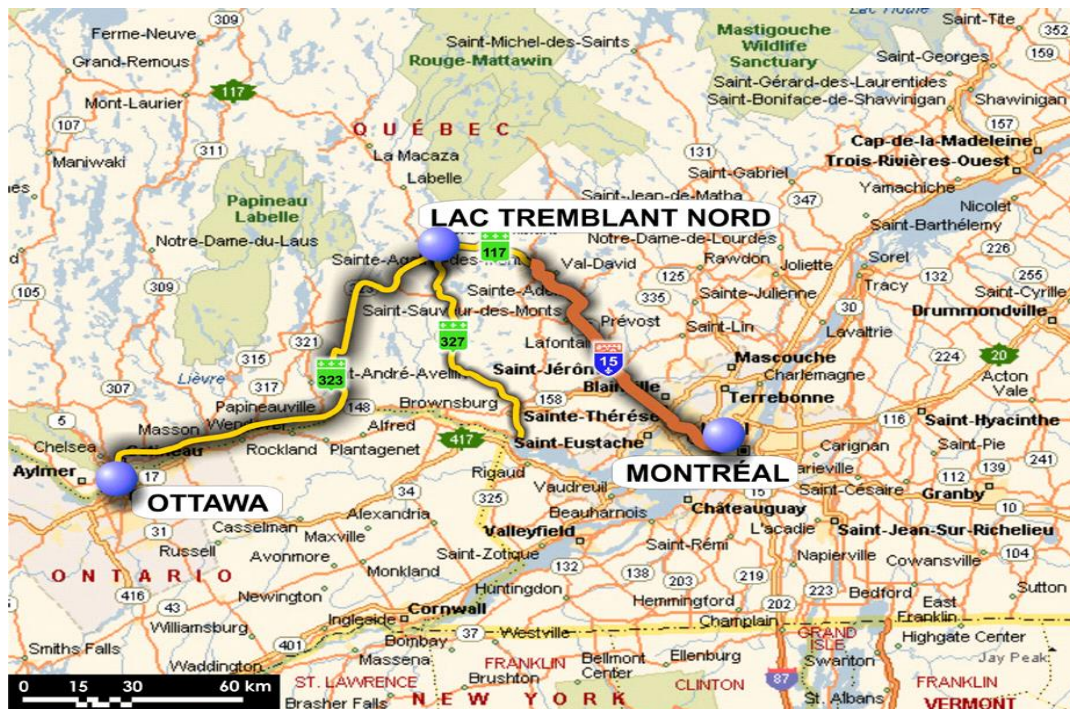
Figure 1 : Localisation de la Municipalité de Lac-Tremblant-Nord par rapport aux pôles urbains

Sur le plan régional, la Municipalité de Lac-Tremblant-Nord fait partie de la MRC des Laurentides. Elle est bornée au nord et à l'ouest par la municipalité de Labelle, à l'est et au sud par la Ville de Mont-Tremblant et au sud-ouest par la Municipalité de La Conception. La figure 2 illustre la situation régionale actuelle.